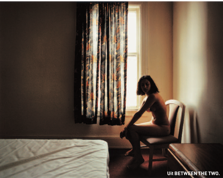
Uit BETWEEN THE TWO.