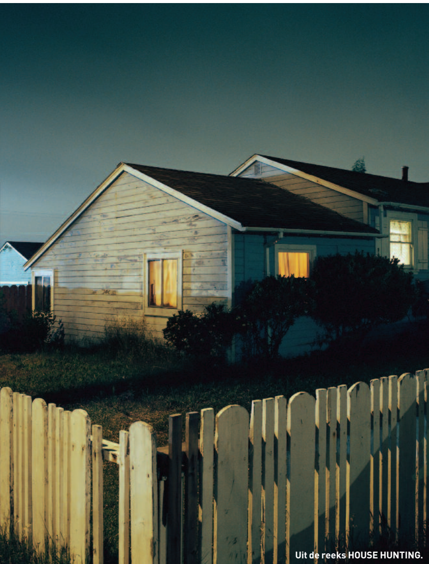
Uit de reeks HOUSE HUNTING.